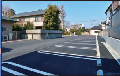
駐車場 隣接した駐車場。