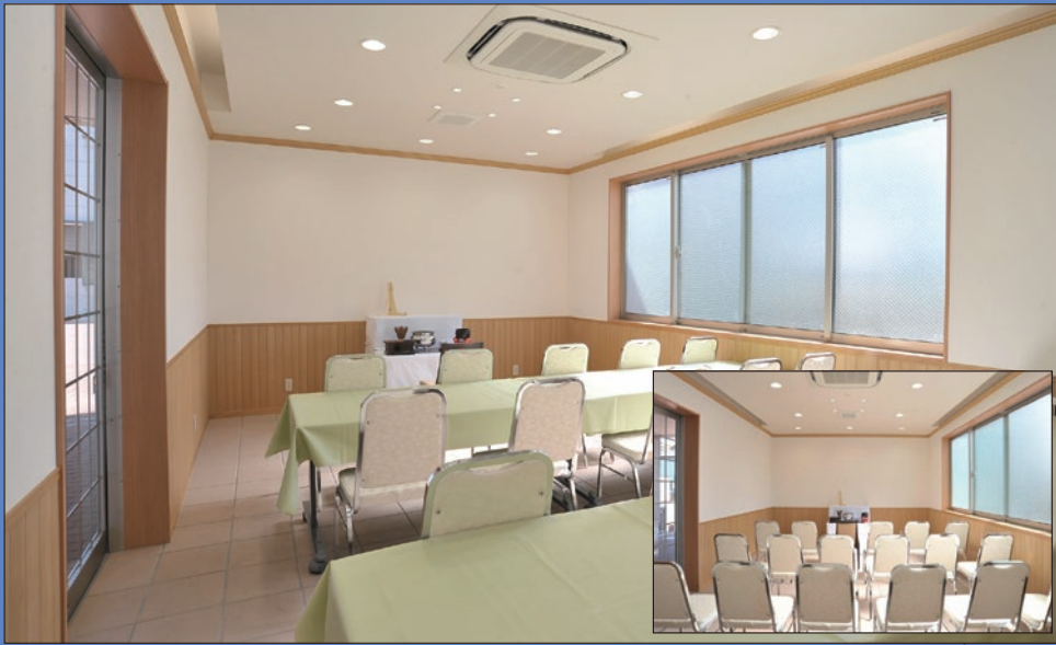
法要会場(洋室) 約20名様まで対応可能です。床暖房完備。